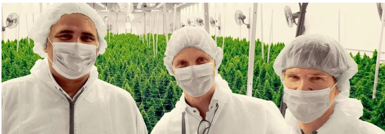
En hygienisk produktion är avgörande för produktkvalitet och patientsäkerhet. Bilden visar STENOCAREs ledningsgrupp som inspekterar CannTrust inomhusodling.