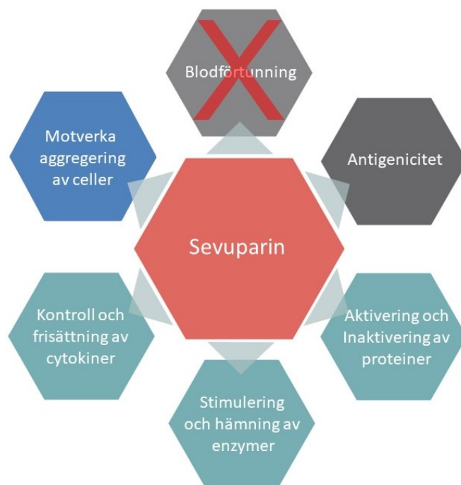
Figur 1. Av de kända potenta effekter heparinoider och sevuparin uppvisar är de grönmarkerade de som är relevanta vid behandling av sepsis och septisk chock. Den blåmarkerade representerar den mekanism som ansågs relevant i tidigare studier om sicklecellsjuka. Blodförtunning är överstruken i figuren då sevuparin, olikt andra heparinoider, inte har blodförtunnande egenskaper. Antigenicitet är kapaciteten hos en kemisk struktur att specifikt binda till en grupp av vissa produkter som har adaptiv immunitet: T-cellreceptorer eller antikroppar.

vanligtvis har blodförtunnande egenskaper. Men till skillnad från andra heparinoider har sevuparin en starkt reducerad antikoagulerande effekt och kan därmed doseras i högre doser och utvärderas utan blödningsrisk. Läkemedelskandidaten är sedan tidigare beprövad i kliniska fas II-studier mot sicklecellanemi och utifrån dessa studier har sevuparin en konstaterad hög tolerabilitet och säkerhet vid behandling av människor. Patientpopulation för sevuparin är alla människor som drabbas av sepsis eller septisk chock. Genom att hjälpa dessa patienter förväntas Modus minska antalet dödsfall och allvarliga komplikationer till följd av sepsis och septisk chock, samt minska bruket av ineffektiva och kostnadsintensiva behandlingsmetoder.